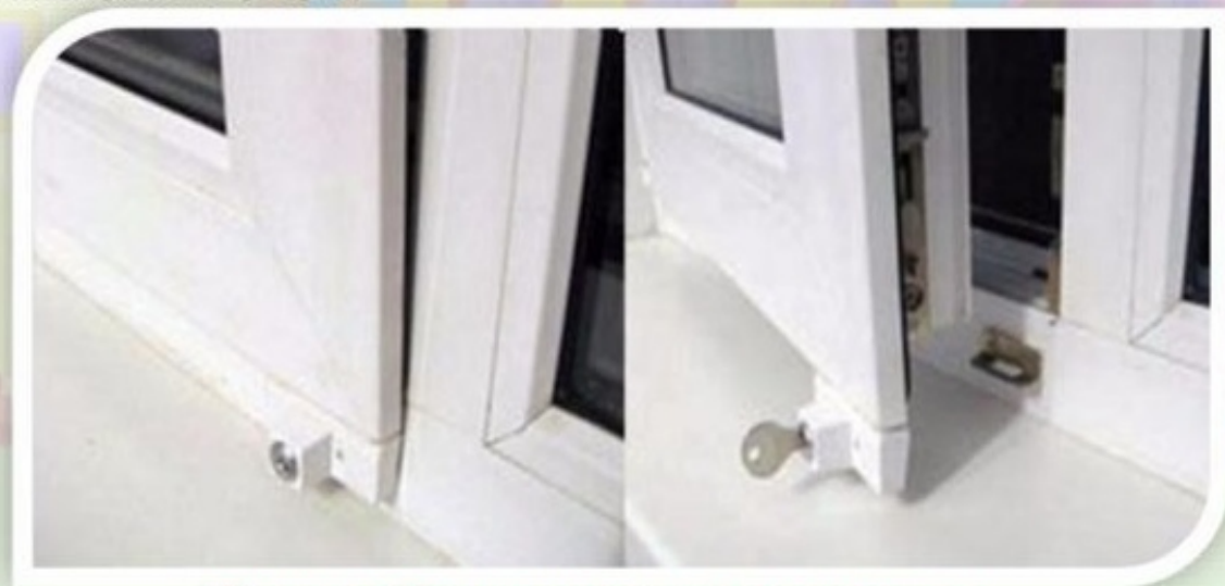
Замок блокировщик с ключом

Можно воспользоваться специальными замками блокираторами, которые предлагают установщики пластиковых окон.